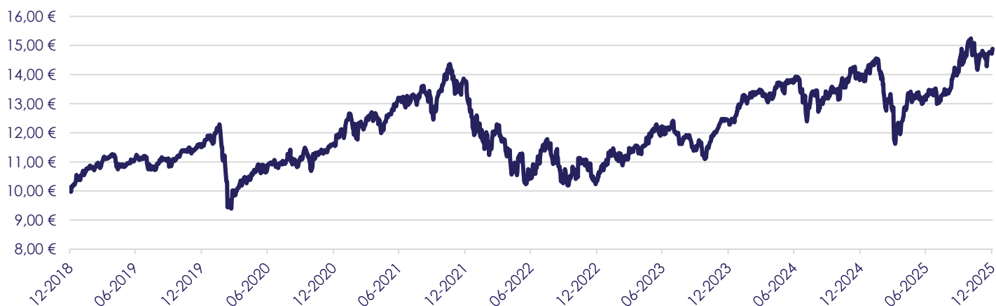
Gráfico de Evolução do Valor das Unidades de Participação em Euros, desde a Criação do Fundo