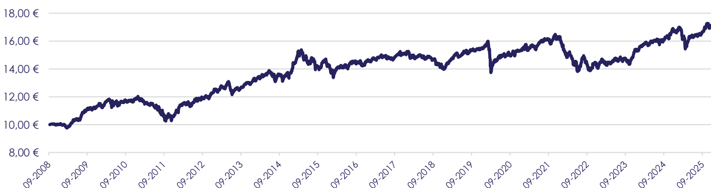
Gráfico de Evolução do Valor das Unidades de Participação em Euros, desde a Criação do Fundo