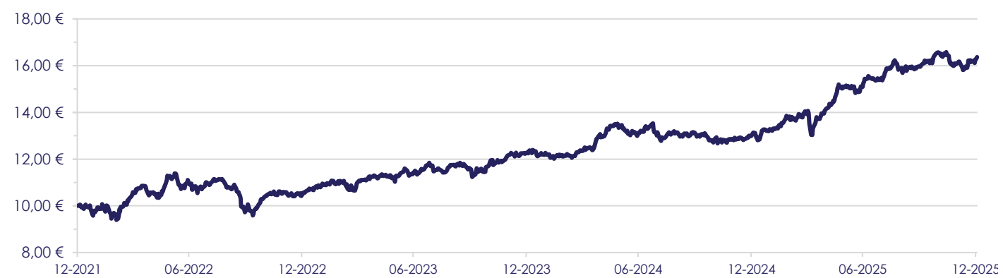
Tabela de Rentabilidade e Risco Histórico

Gráfico de Evolução do Valor das Unidades de Participação em Euros, desde a Criação do Fundo.