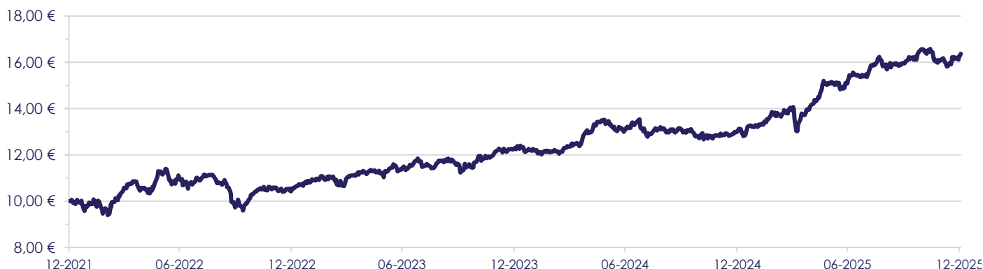
Gráfico de Evolução do Valor das Unidades de Participação em Euros, desde a Criação do Fundo.